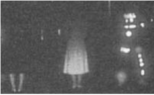
黒っぽい服装 白っぽい服装 反射材