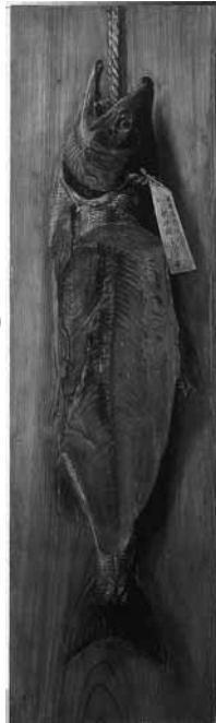
高橋由一「鮭図」 笠間日動美術館蔵

江戸から明治へ移り変わる激動の時代、西洋からもたらされた絵画に魅せられ、新しい技法や表現を修得しようと奮闘した画家たちがいました。その情熱で日本の美術界に新たな道を切り拓いた高橋由一、黒田清輝、青木繁らの秀作約120点をご紹介します。ぜひご覧ください。