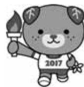
愛媛国体マスコット みぎゃん

参加するすべての人々が、愛媛を駆け抜ける風のように舞い輝く大会となることをイメージし、愛媛らしく俳句仕立てにしています。