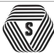
厚生労働大臣認可