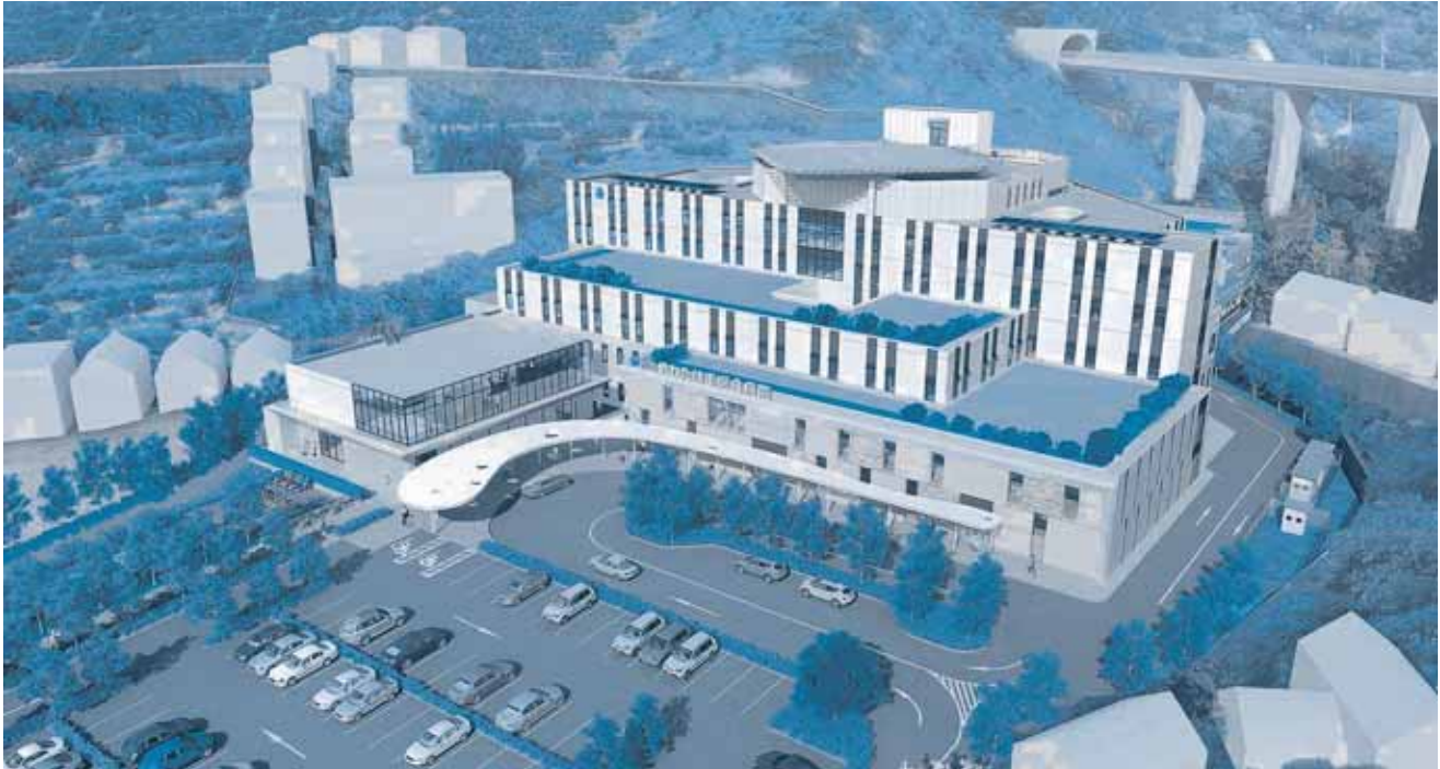
完成イメージ図（本図はイメージであり、実際とは異なる場合があります）

建設場所は市立病院の現在地ですので、取り壊しながらの建設となり4年間の長期工事となります。工事期間中は、近隣住民の皆さまをはじめ患者の皆さま方には、ご迷惑とご不便をおかけしますがご理解とご協力をいただきますようお願いいたします。