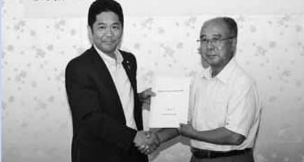
株式会社あわしま堂