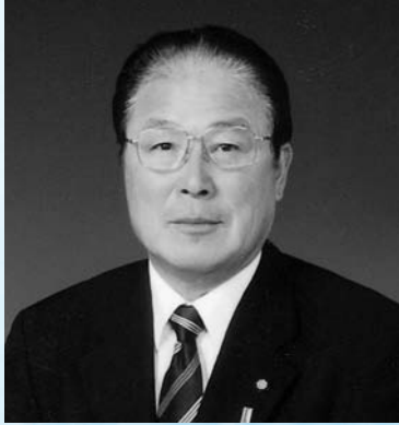
八幡浜市議会議長