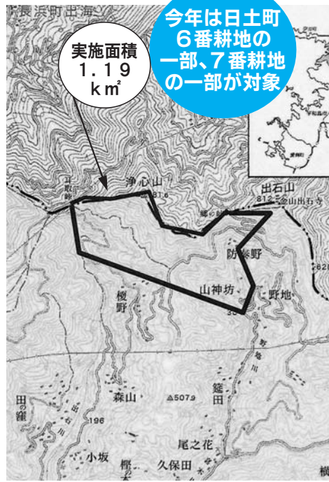
平成22年度 地籍調査実施区域

八幡浜市では、昭和48年から地籍調査を実施しています。平成22年度は、日土町6番耕地の一部、7番耕地の一部の区域を実施します。