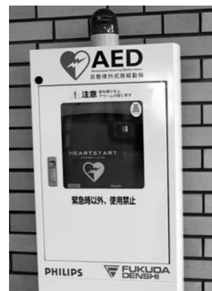
市役所八幡浜庁舎のAED

八幡浜地区消防署では一年間を通してAED講習会を開催していますので、大事な人を守るために、ぜひ、受講してください。また、他の応急手当講習会も行っておりますので、ぜひ参加してみてください。