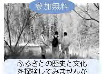
ふるさとの歴史と文化を探検してみませんか

八幡浜市教育委員会生涯学習課 文化振興係 ☎22-3111(内線8357) FAX 36-3041