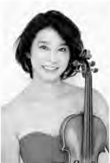
高嶋 ちさ子 (ヴァイオリン)