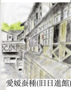
愛媛蚕種(旧日進館)