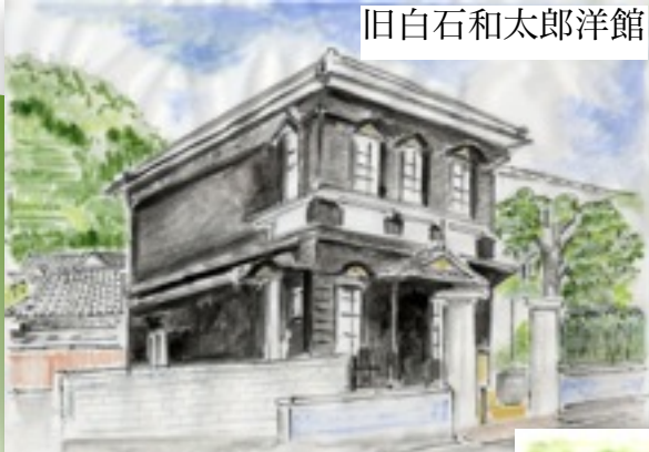
旧白石和太郎洋館