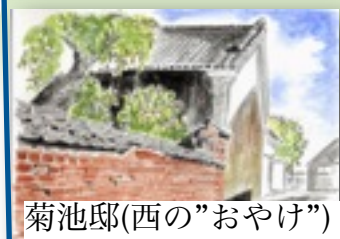
菊池邸(西の"おやけ")