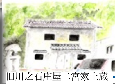
旧川之石庄屋二宮家土蔵