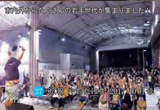
市内外からたくさんの方々が集まりました！