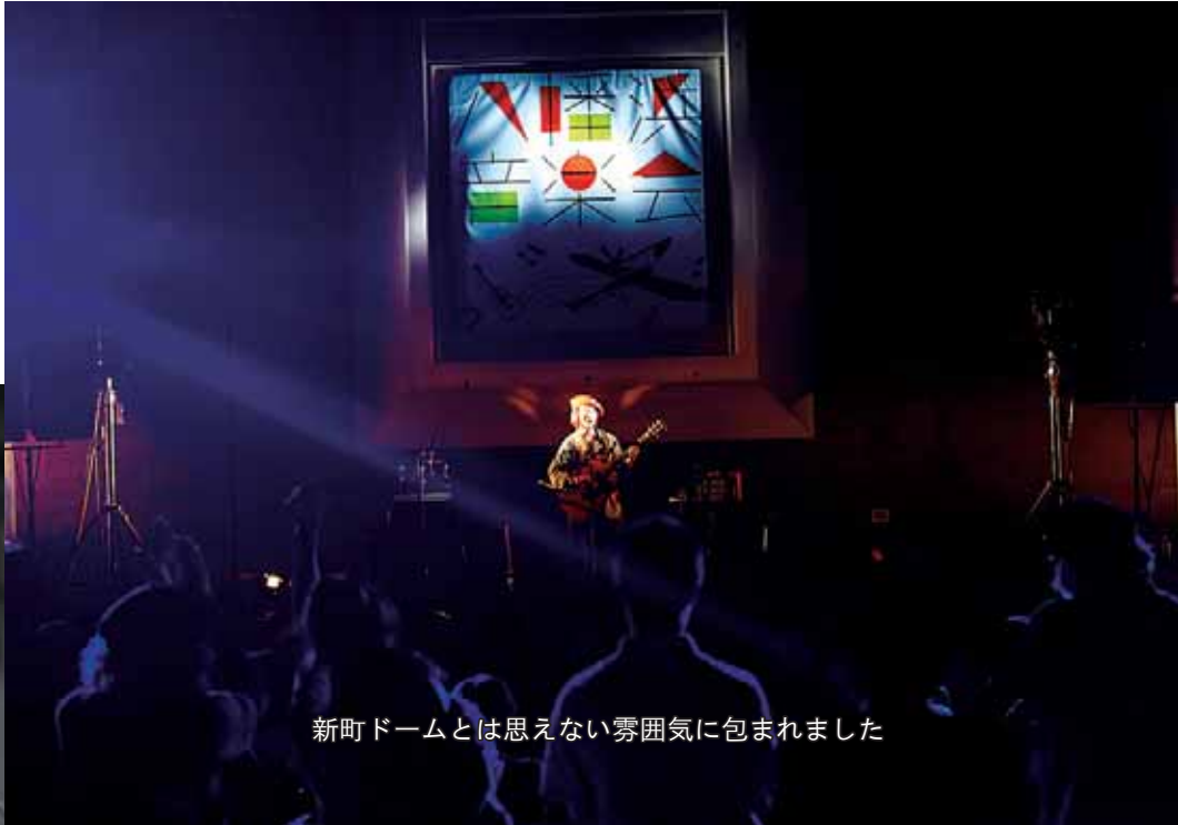
新町ドームとは思えない雰囲気に包まれました