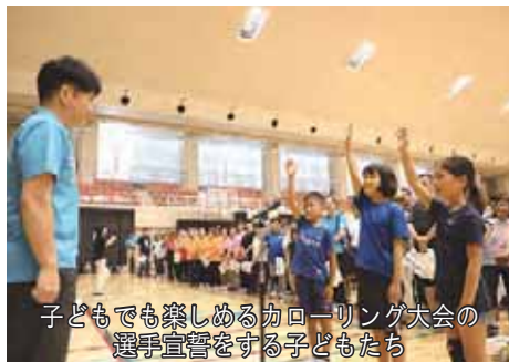
子どもでも楽しめるカローリング大会の選手宣誓をする子どもたち