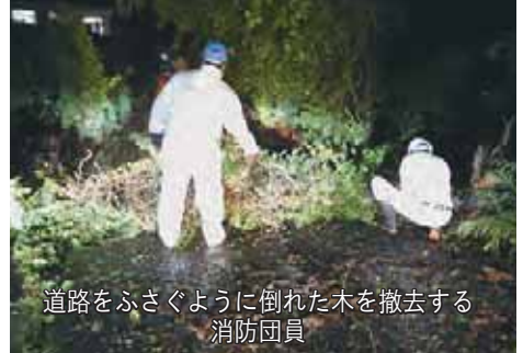
道路をふさぐように倒れた木を撤去する消防団員