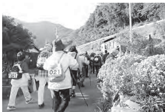
老若男女、誰でも自分のペースでゴールを目指せます。

八幡浜市国際交流協会事務局(市役所政策推進課内) ☎22-3111 内線1345