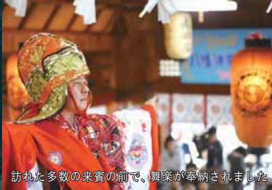
訪れた多数の来賓の前で、舞楽が奉納されました