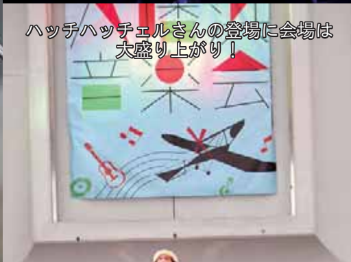
ハッチハッチェルさんの登場に会場は大盛り上がり！