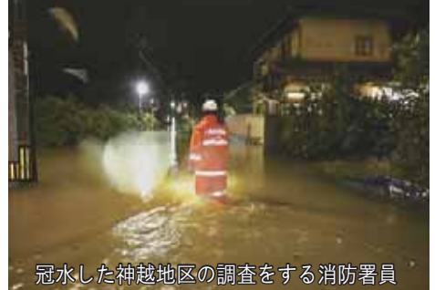
冠水した神越地区の調査をする消防署員

広報ギャラリー フェイスブックページ 広報に掲載しきれなかった写真や動画を発信しています。