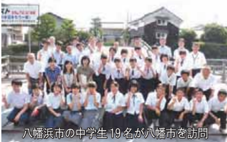
八幡浜市の中学生19名が八幡市を訪問