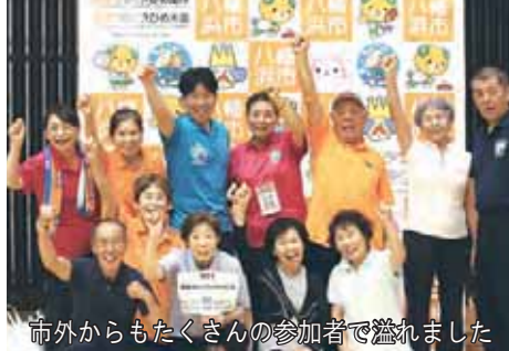
市外からもたくさんの参加者で溢れました