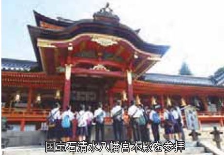
国宝石清水八幡宮本殿を参拝