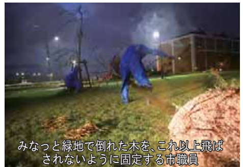
みなと緑地で倒れた木を、これ以上飛ばされないように固定する市職員