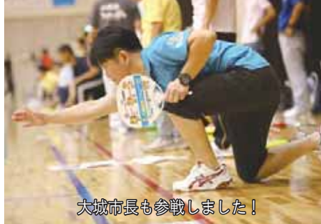
大城市長も参戦しました！