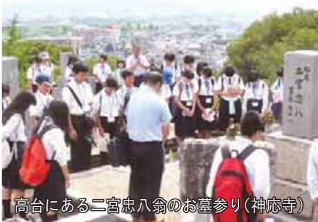
高台にある二宮忠八翁のお墓参り(神応寺)