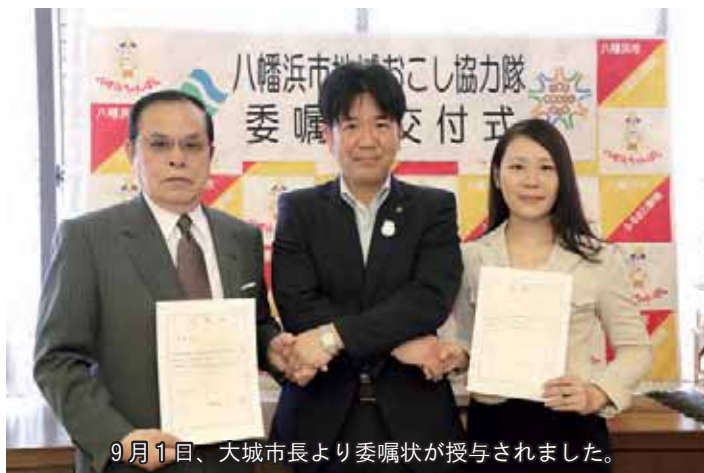
9月1日、大城市長より委嘱状が授与されました。

出身:大分県大分市 担当:移住・定住促進 趣味:温泉・銭湯めぐり、 自然・野鳥観察、 お城・神社めぐり、園芸