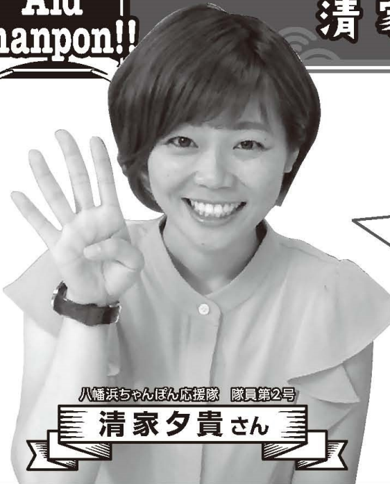
八幡浜ちゃんぽん応援隊 隊員第2号