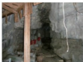
穴なんど入口 (2015年2月14日 日土)