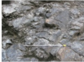
穴井浄化センターの蛇紋岩 (2015年1月12日 穴井)