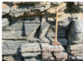
貝付小島のチャート (2013年8月27日 大島)