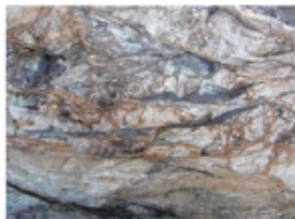
大島のシュードタキライト (2013年8月27日 大島)