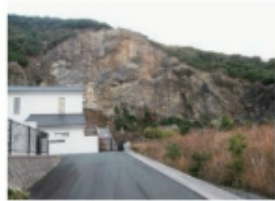
穴井浄化センターの蛇紋岩 (2015年1月12日 穴井)