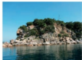
貝付小島のチャート (2013年8月27日 大島)