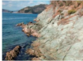
矢野崎の緑色片岩 (2015年2月14日 矢野崎)