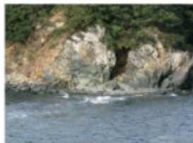
おずみ島の角閃石岩 (2015年1月12日 大釜)