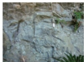
穴なんど付近の石灰岩 (2015年2月14日 日土)