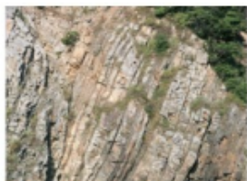
真穴層の砂岩の露頭 (2013年8月27日 大島)