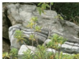
三王島の石灰岩 (2014年4月19日 大島)