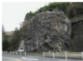
国道197号線沿いの石灰岩 (2015年1月12日 横畑)