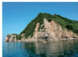
真穴層の砂岩の露頭 (2013年8月27日 大島)