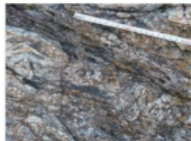
大島のシュードタキライト (2013年8月27日 大島)