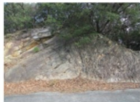
両訪崎の黒色片岩 (2015年1月12日 諏訪崎)