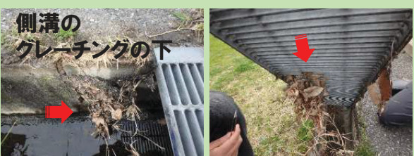
側溝のグレーチングの下