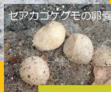
セアカゴケグモの卵嚢