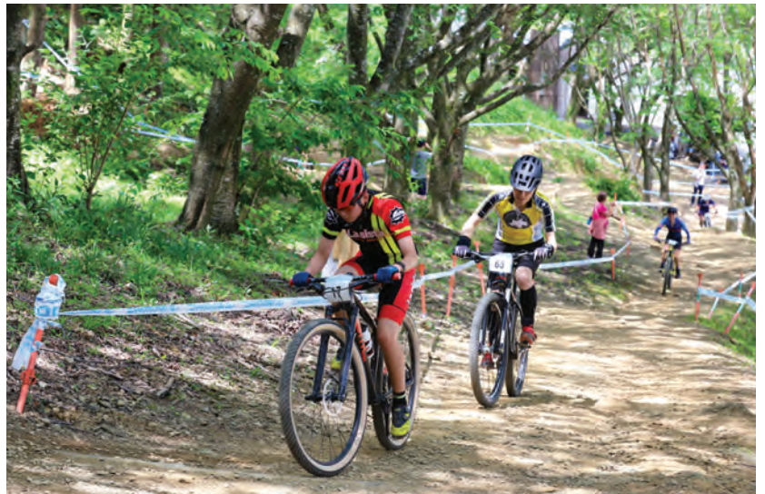
▲桜坂の険しい登り。懸命にペダルを回します。