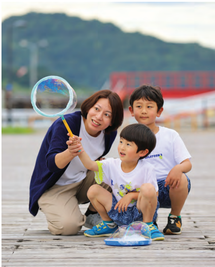
撮影場所:八幡浜みなと

私の家には小学2年生と年長の息子がいます。家のすぐ隣に祖父母が住んでいるので、6人家族のような生活です。祖父母には子どもたちのことでもよく助けてもらっています。