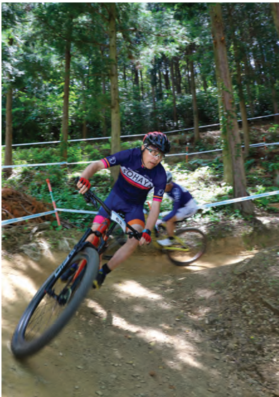
▲迫力ある桜坂の下りは爽快感も抜群!