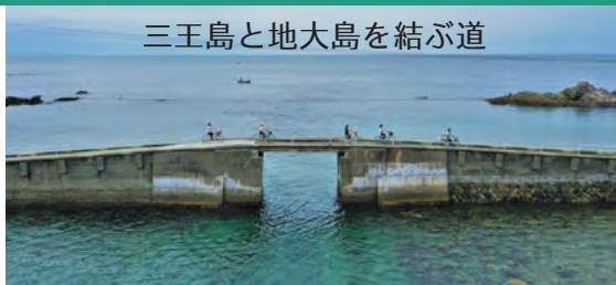
三王島と地大島を結ぶ道