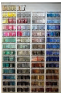
アートワーク 「太清の絵具棚より」