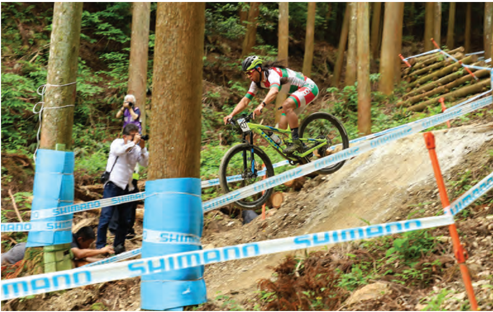
▲高さのある急斜面も勢いよくジャンプ! (上級者コース)

21年経った現在はUCI(国際自転車競技連合)から、国内で唯一、最高峰のオー・クラスの認定を受けるまでに成長。さらに、2004年のアテネオリンピック以降、4大会連続でオリンピック日本代表を決める選考レースにも採用されるなど、ハイレベルな大会として海外選手からも注目されるようになりました。トップライダーもうなる、テクニカルで楽しい名コースとして親しまれています。