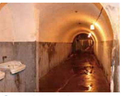
11 八幡濱第一防空洞

八幡濱以海港發展而繁榮，與九州、大阪進行商貿往來。船塢路和濱之町如今仍保留著商家建造的白牆格窗美麗房屋。