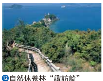
12 自然休養林「諏訪崎」

真正具有意義的要數在四國建造的第一個防空洞。1940年5月份動工，第二年的2月份竣工。美軍飛機機槍掃射時，市民多次躲到這個防空洞中避難。