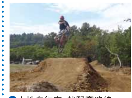
15 山地自行車 越野賽路線

八幡濱是四國屈指可數的拖網漁業基地。飄著豐收旗進港的拖網漁船，天還沒亮就在魚市場熱血沸騰地呼喊着“TEYA TEYA”的口號幹勁十足。