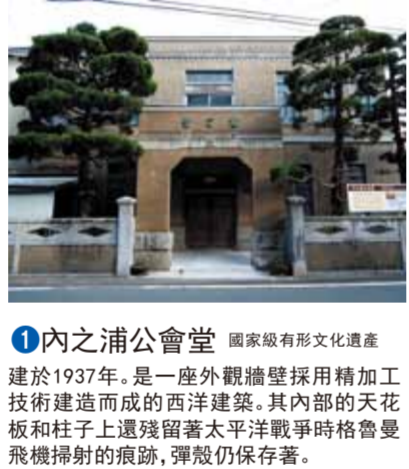
1 內之浦公會堂 國家級有形文化遺產

四季分明，八幡濱這塊溫暖的土地到處充滿著大自然的氣息以及傳承了許多讓人緬懷的歷史韻味，遊客們可以在此駐足觀賞。 位於佐田岬半島的根部，北面是瀨戶內海，南面是宇和海。這裡自然條件豐富，有許多的觀光景點。開車兜風時可隨性停車，與大自然進行一次心靈的對話也是極好的。