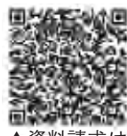
▲資料請求はこちら

また、60歳以上65歳未満の方や海外に居住されている方で国民年金に任意加入している方も加入できます。