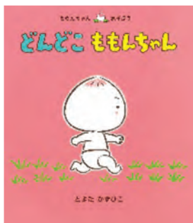
「どんどこももんちゃん」