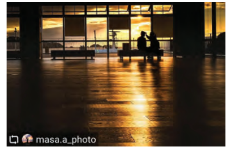
八幡浜港フェリーターミナル 展望ロビー 沈む夕日がロビーにも入り込み、 素敵な雰囲気的空間が生まれま す。八幡浜の新しいフォトスポッ トです♪