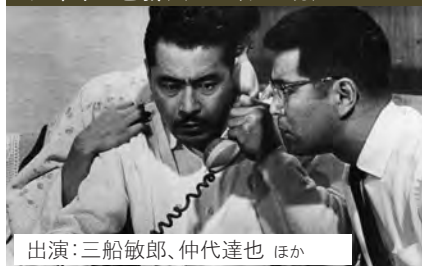
出演:三船敏郎、仲代達也 ほか