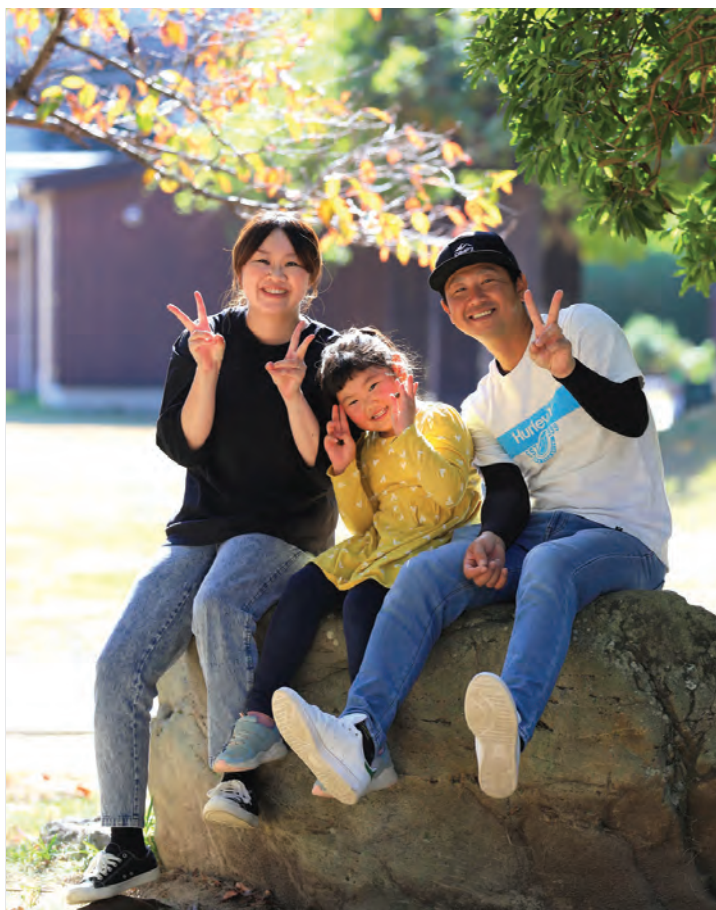
撮影場所：王子の森公園

来年からは小学生。娘も学校生活が待ち遠しいようです。私たちもサポートしながら、成長を楽しみたいと思います。