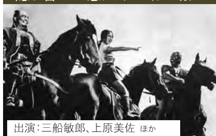
出演:三船敏郎、上原美佐 ほか