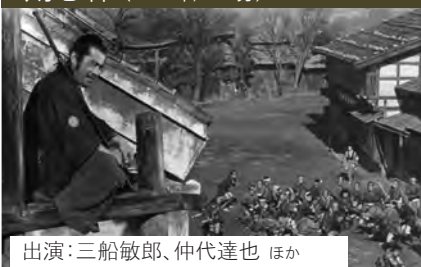
出演:三船敏郎、仲代達也 ほか