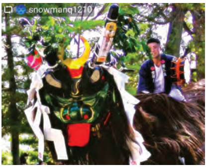
保内町 三島神社 牛鬼 地域を練り歩き、家ごとに首を 突っ込み、お祓いをしてくれる 牛鬼。秋祭りでの迫力満点な1 枚です！