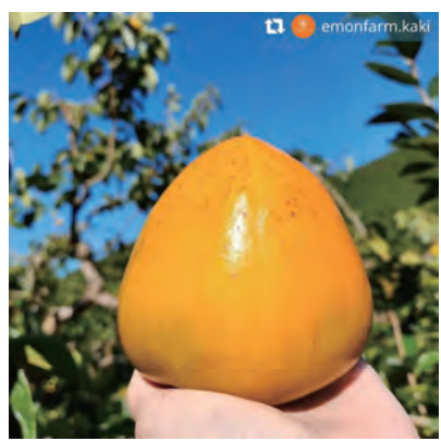
八幡浜の富士柿 いよいよ、みかんの収穫シーズンが 始まりましたが、八幡浜の秋の味覚 で忘れてならない「富士柿」！渋抜 きされ、美味しく食べられるまで待 ち遠しいですね♪