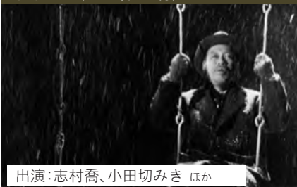
出演:志村喬、小田切みき ほか