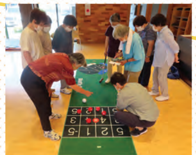
▲川之石地区公民館のシャッフルゴルフ交流

たくさんのつながりを持っておくことは認知症予防にも効果があると言われています。あなたも公民館活動に参加して、新しいつながりを作りませんか？（興味のある方は、 各地区公民館までお問い合わせください。 ）