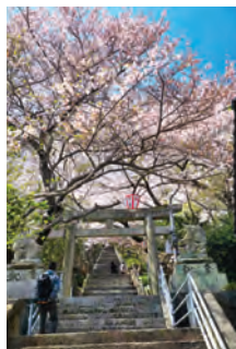
保内町川之石 (琴平公園)