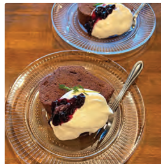
※写真は気まぐれごはん・スイーツの一例です