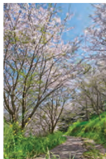
市民スポーツパーク フラワーゾーン