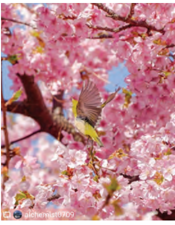
喜木津地区の桜とメジロ メジロの羽ばたきを見事に写していただきました。桜のピンクにメジロのグリーンが美しい1枚です。