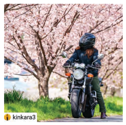
喜木津地区の河津桜 愛車とのお花見を撮影いただきました。春風に乘ってのツーリング、気持ち良さそうです♪