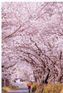
保内町喜木 (喜木川沿い)