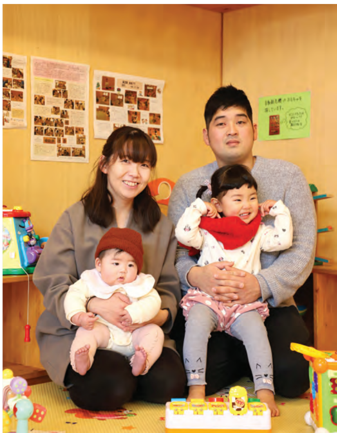
撮影場所: 保内児童センター だんだん

2歳7か月のお姉ちゃんと5か月の妹、2人の子 どもがいます。お姉ちゃんはおしゃべりが大好きで 人懐っこく、祖母や近所の方からもいつも可愛がっ てもらっています。その甲斐あってか、母が不在で も平気な2人、なんだか寂しく感じることも…(笑) つい先日、100歳で亡くなった曾祖母にも、いつも 笑顔で「ひいばあちゃん!!」と抱きついて行って いたお姉ちゃん。曾祖母もデイサービスで「曾孫に あげるんよ」とマフラーと帽子を一生懸命編んでい たようで、それを貰った2人はとても嬉しそうにし ています。