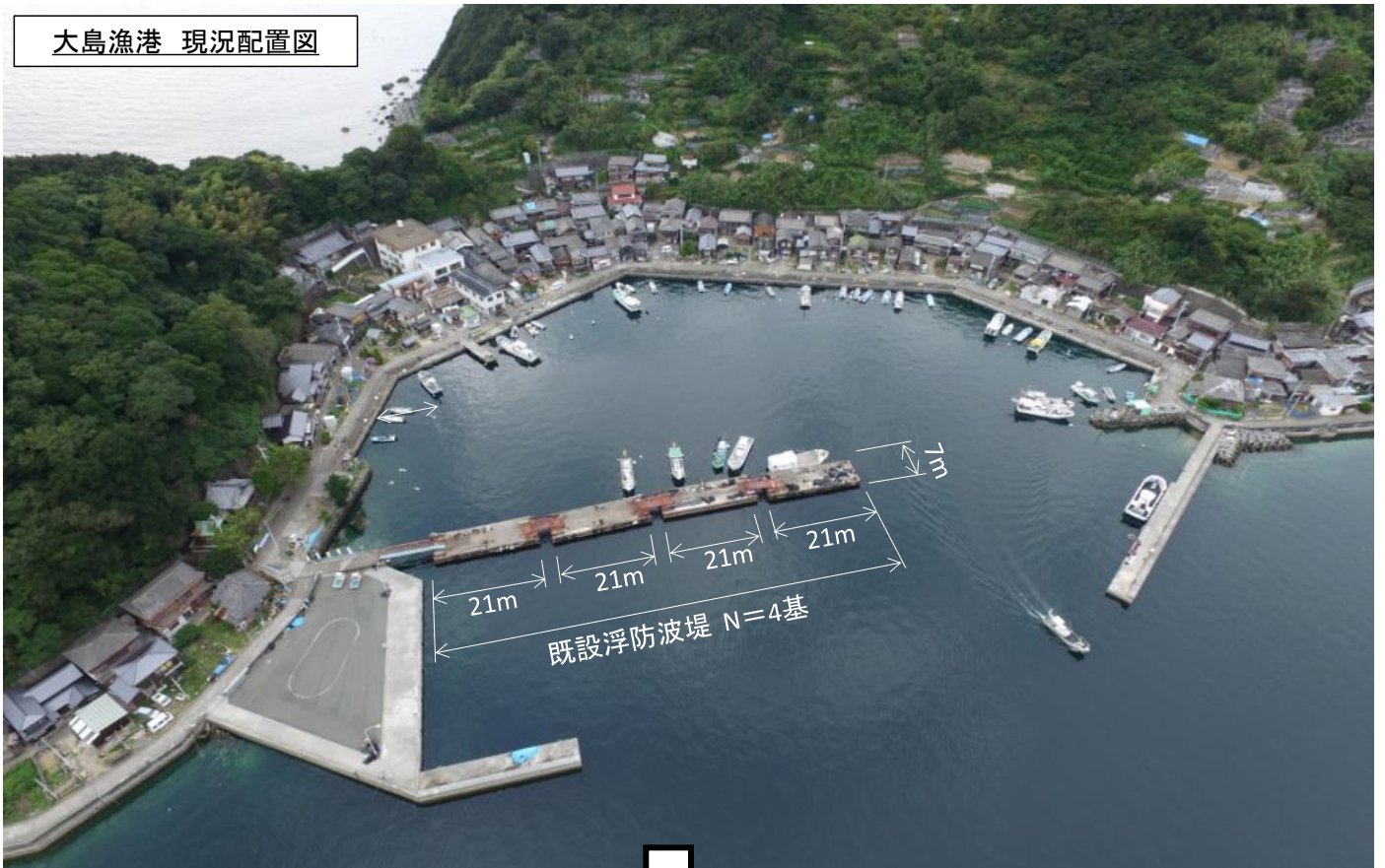
大島漁港 現況配置図