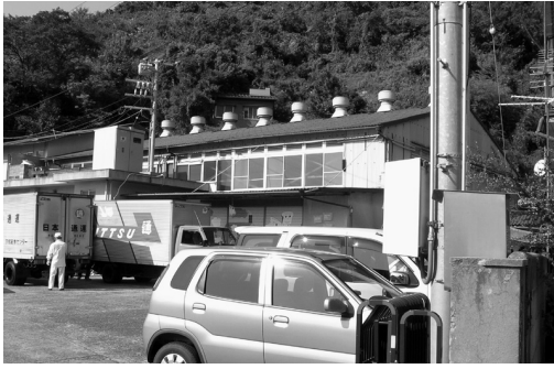
八幡浜学校給食センター

員会内部において、給食センターの建て替え検討委員会を立ち上げ、現在までに会議を2回開いて検討を行っている。