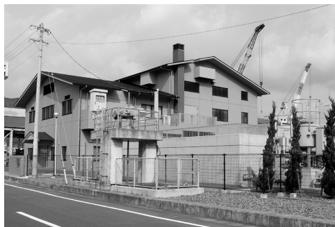
保内浄化センター

問 及活動を行なっており、今年度は、来月から、個別訪問を行なう予定である。 普及率が低いと思われるが、その原因は何か。