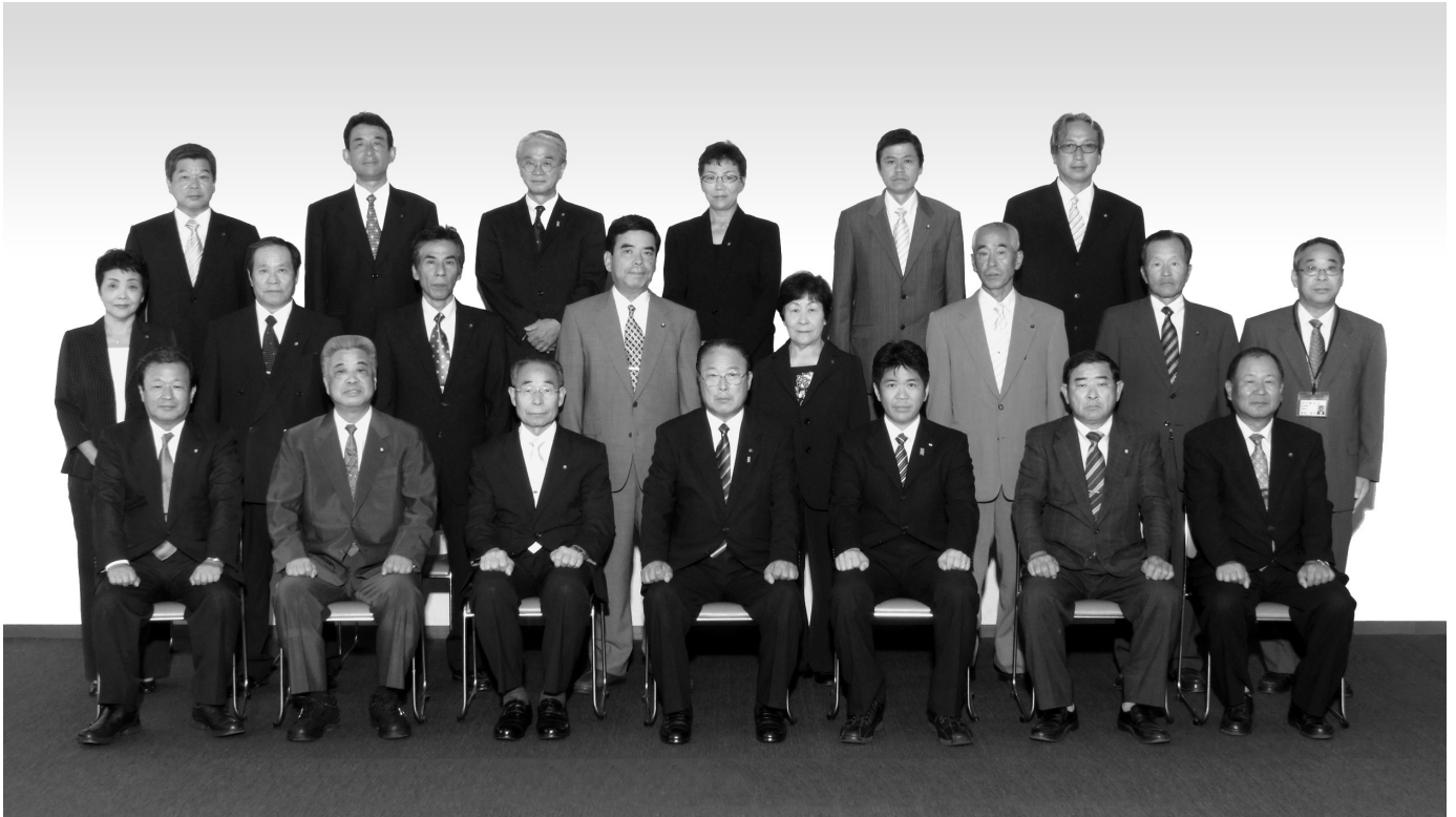
第 3 期 八幡浜市議会議員と市長