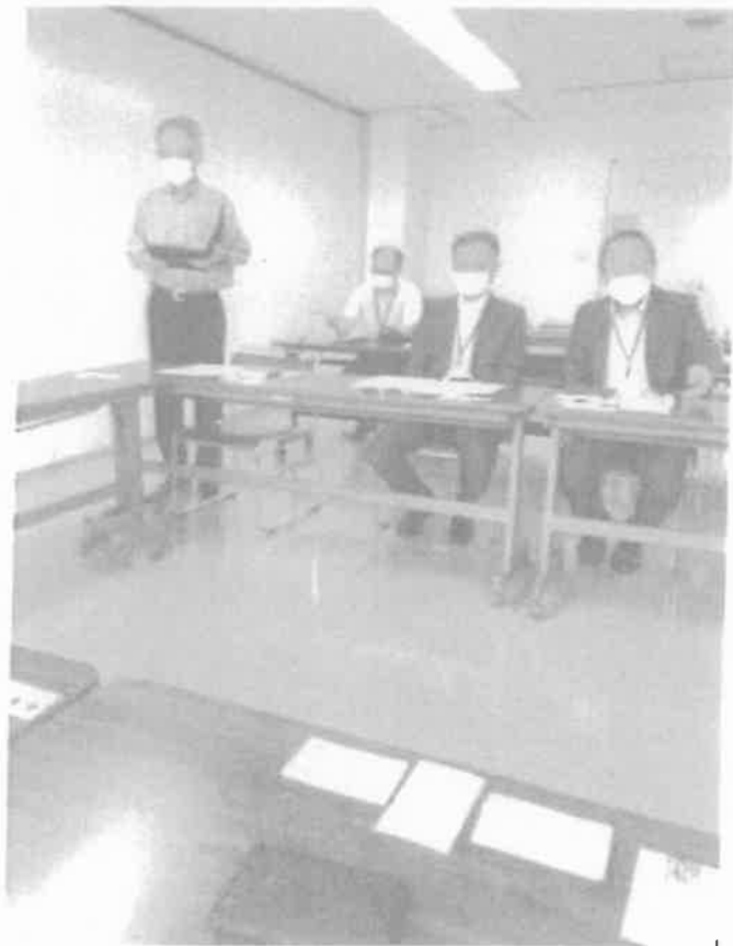
担当部課長様とのご挨拶