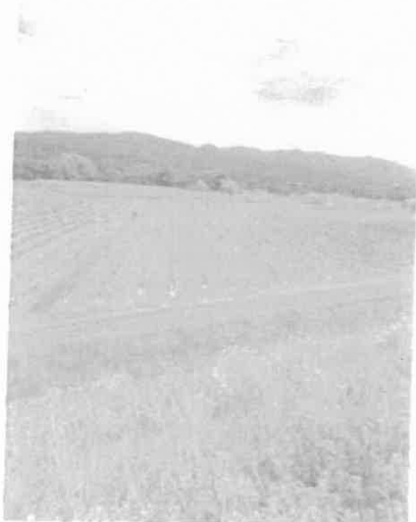
肥沃な河原地帯 里芋