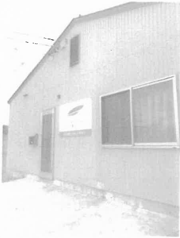
(株) フジスマイルファーム