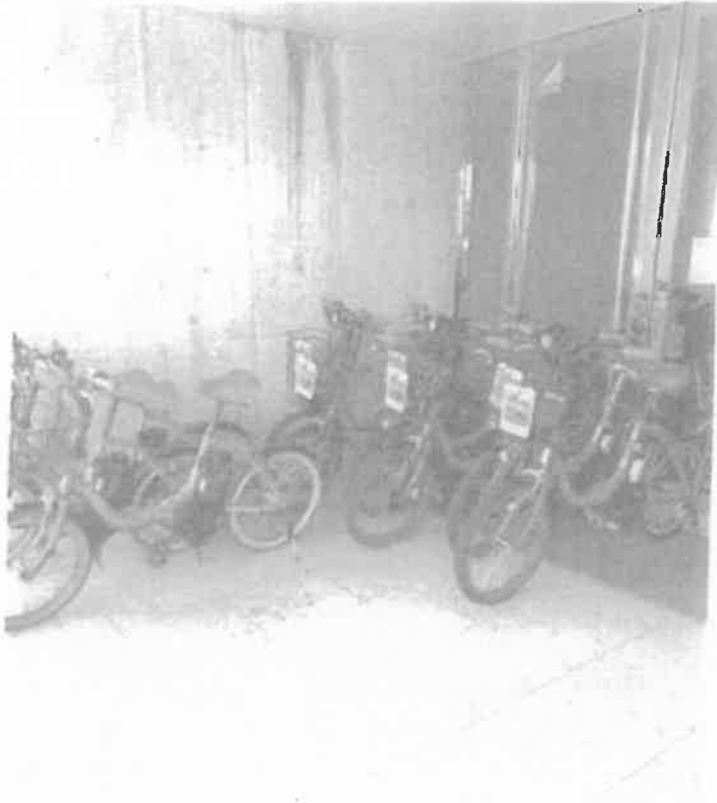
レンタサイクル 電動アシスト付き