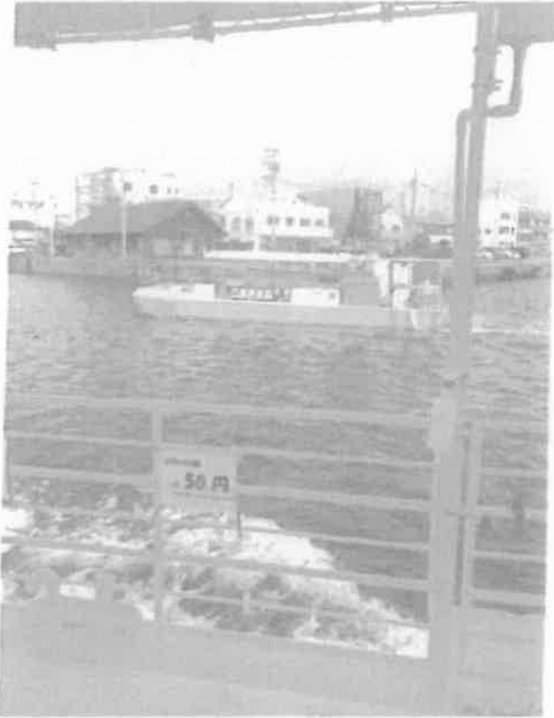
公社運航のグラスボート