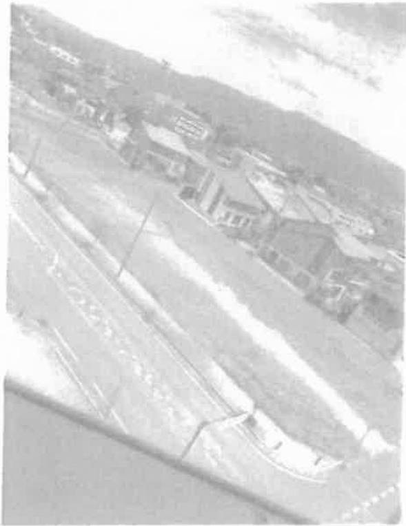
ホテル建設予定地 飯山駅前