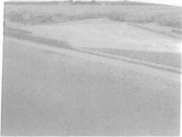
郊外の畑 大根や薬物野菜