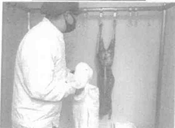
NPO森の息吹鹿肉冷蔵室