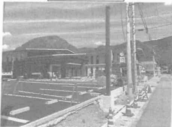
松野町役場新庁舎