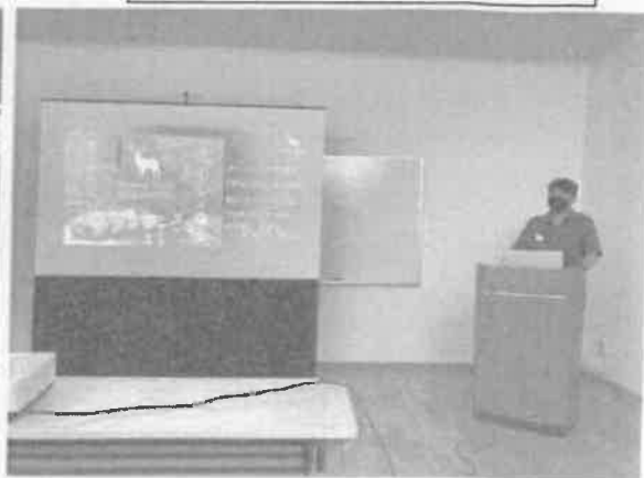
NPO森の息吹 業務内容説明